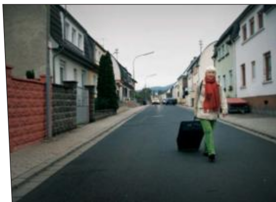
«Å leve uten penger» er spilt inn i både Tyskland, Italia og Østerrike.